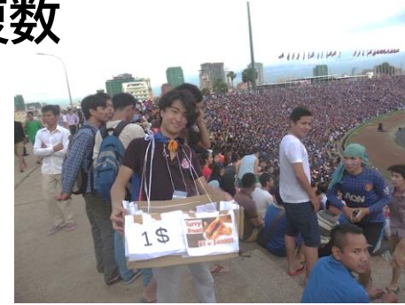
サッカースタジアム