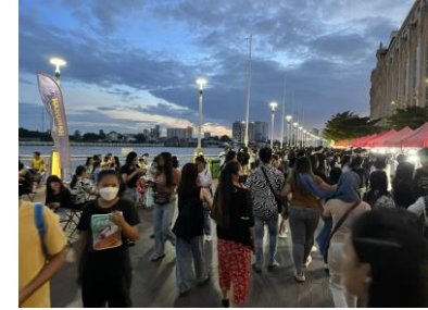
ウィークエンドマーケット